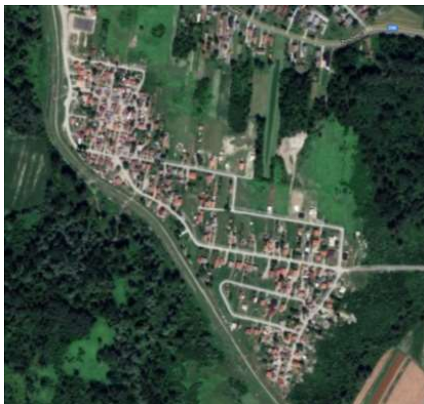
Prikaz 1 Parag – ortofoto stanja 2011. (Geoportal) i 2019. (Google maps)